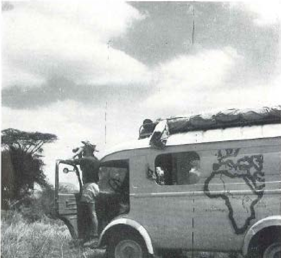
A. Mahuzier à la poursuite des rhinocéros (Kenya).