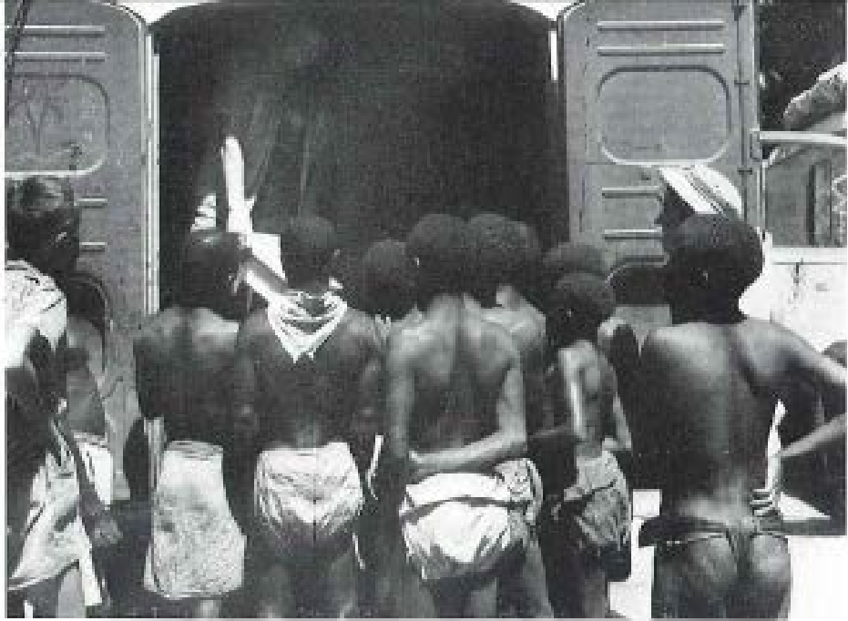
Renault chez les Pygmées.