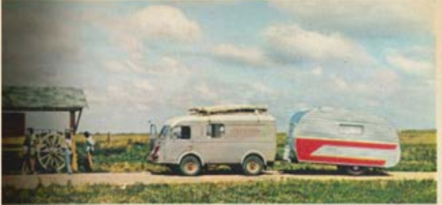
UN VOYAGE TRANSCANADIEN, VOUS DE TROUVER DU PAYS : LA CHEVROLET A DÊTÉ ROULEE SUR PNEUS PNEUMATIQUES.