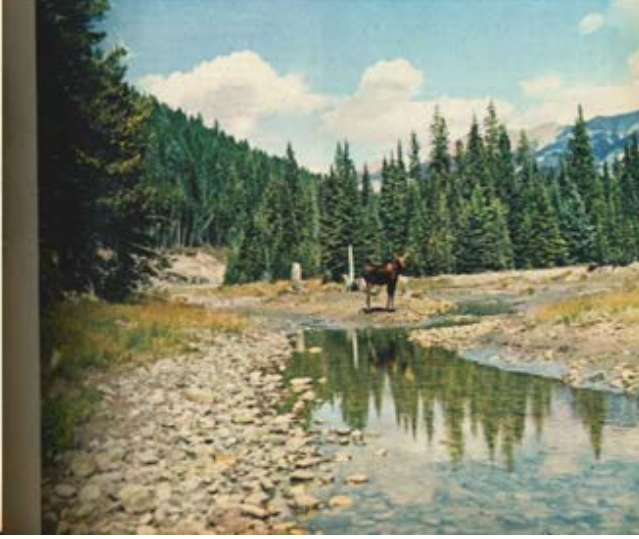
PARCOURS FLORISSANT DU CANADA, DES MONTAGNES, DES PAYSAGES DIVERS, UN FORÊT ET UN JOUR ORIGINAL DONT VILAIN.